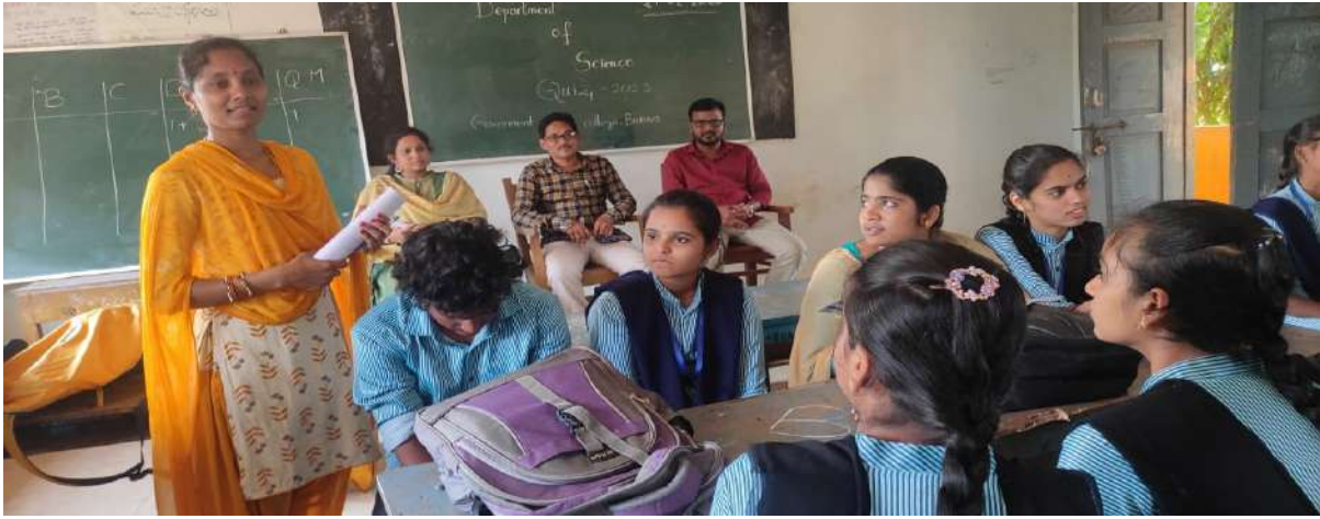
As a Part of Azadi ka Amrut Mahotsav and Science day Celebrations, Dept. of Physics and Chemistry organized a Quiz in Science Subjects 27.02.2023